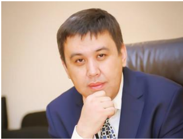
Председатель Правления АО «Агентство Хабар» Ажибаев Алан Газизович